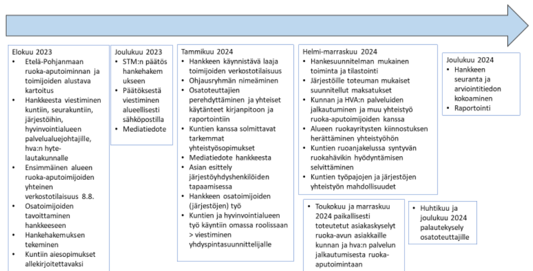
Kuva 1 Kuva hankeaikataulusta

Hankkeen toimenpiteitä koskeva aikataulu on kuvattu kuvaan 1.