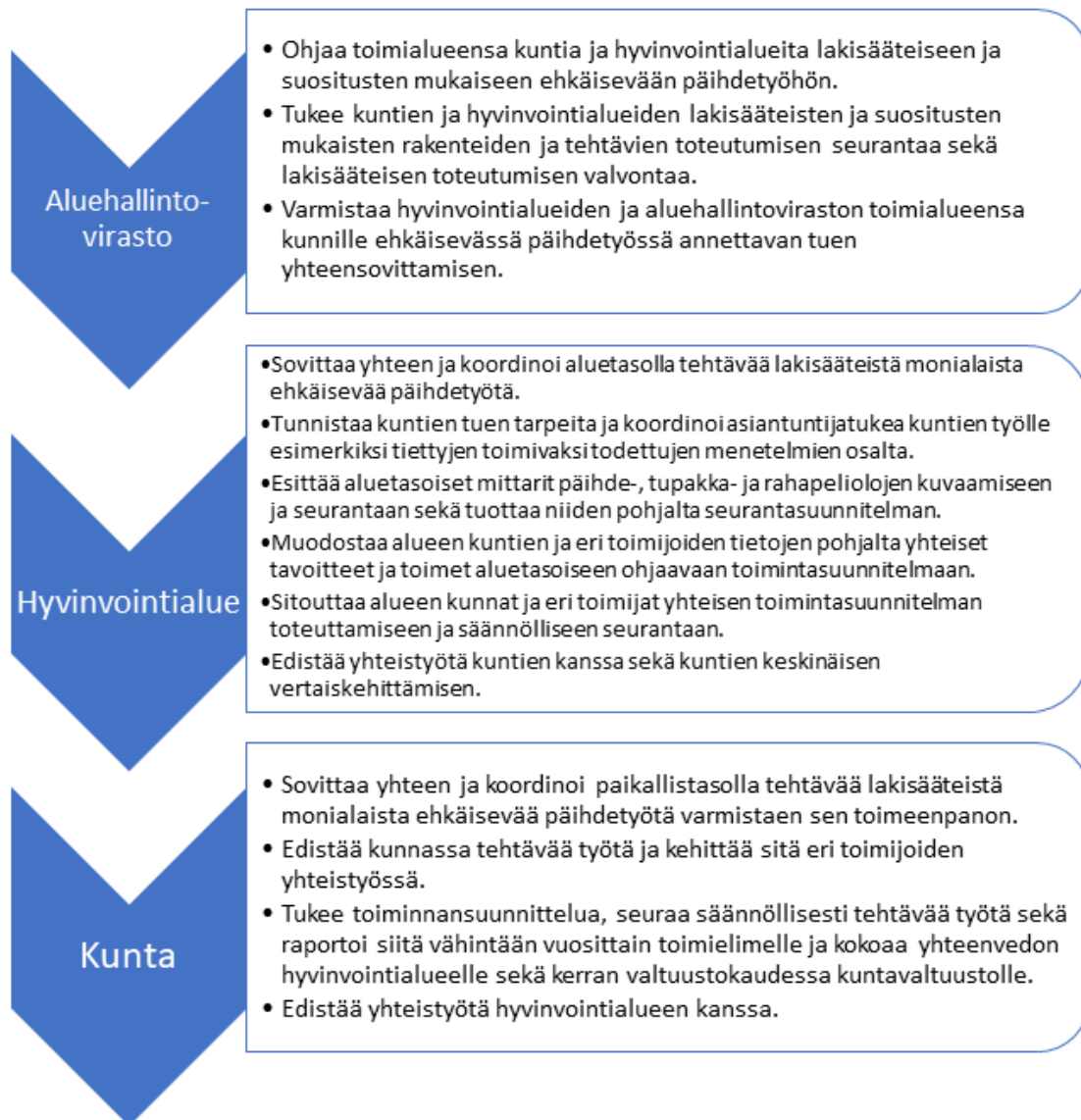
Kuva 2. Esimerkki kunta- ja aluetason monialaisten työryhmien ehkäisevän päihdetyön tehtävistä. (THL).